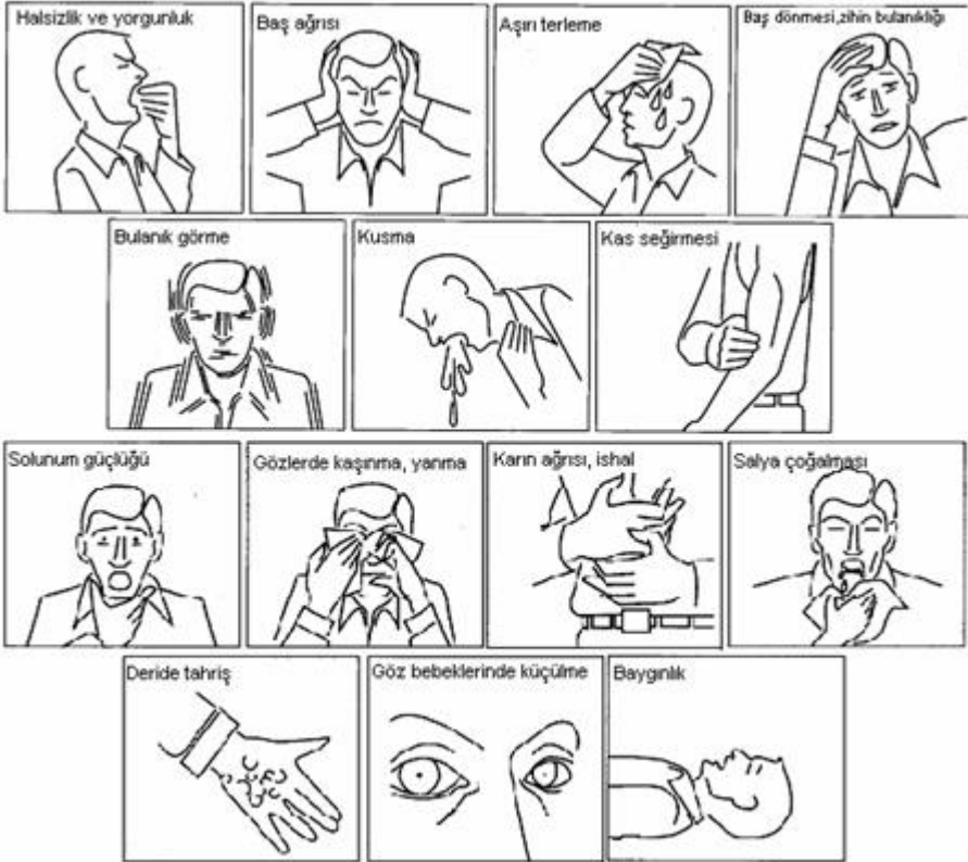
Resim 2. Zirai mücadele ilaçlarından zehirlenme belirtileri.

Eğer deri yoluyla örneğin bir kişinin üzerine dökülmesi sonucu zehirlenme söz konusu olmuşsa yapılabilecekleri şöyle sıralayabiliriz. Bulaşık giysiler hemen çıkarılmalı ve vücudun zirai mücadele ilacıyla bulaşık kısmı önce bol su ile, daha sonra da sabun ve su ile yıkanmalıdır. Bunlar yapıldıktan sonra ya temiz bir giysi giydirilmeli veya battaniyeye sarılarak doktor beklenmelidir. Göze sıçraması durumunda ise göz kapakları açık olacak şekilde en az 10 dakika bol ve temiz suyla yıkanmalı ve mümkünse bir göz doktoruna gösterilmelidir.