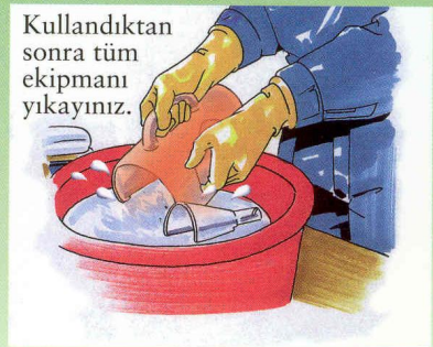
Resim 3. Zirai mücadele ilacının bulaşması durumunda yapılması gerekenler.

Hasta titreme ve çırpınma halinde ise dilini ısırması için dişlerin arasına temiz beze sarılmış sert bir cisim yerleştirilmeli, takma diş varsa çıkarılmalıdır. Herhangi bir zehirlenme durumunda en kısa sürede ambulans çağrılmalı veya Zehir Danışma Merkezlerinden bilgi alınmalıdır.