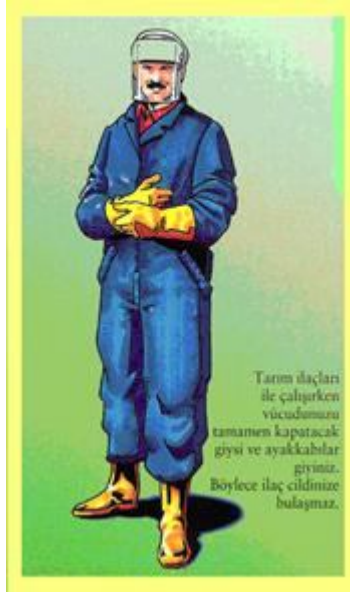
Resim 5. Zirai mücadele ilaçları ile çalışırken giyilmesi gereken kıyafet.

İlacı hazırlarken ve ilaçlama yaparken zehirlenmeyi engellemek için uygulayıcının mutlaka koruyucu ekipman kullanması gerekir. Kullanılan zirai mücadele ilacına göre değişmekle beraber, eldiven, maske, koruyucu gözlük, şapka, çizme, koruyucu giysi bu ekipmanlar içerisinde sayılabilir. Uygulayıcının ilaçlama sırasında giyeceği uzun kollu bir kıyafet bile zirai mücadele ilacının doğrudan cildine temasını önleyeceği için koruyucu bir giysidir. Her bir ilaçlamadan sonra ayakkabı dahil olmak üzere giyilen kıyafetlerin diğer giysilerden ayrı olarak yıkanarak temizlenmesi de önemlidir. Böylece bir sonraki ilaçlama sırasında temiz giysi giyilerek zirai mücadele ilacı ile cildin teması engellenmiş olur. Zehirlenmelerin pek çoğu ilaçlama yapan kişilerin ellerini yıkamadan bir şey yemeleri, içmeleri veya sigara kullanmalarından meydana gelmektedir. Bu nedenle, ilaçlamaya her ara verildiğinde ellerin ve vücudun ilaç değen kısımlarının bol suyla yıkanması ve ilaçlama bittiğinde de duş alınması zehirlenmeyi azaltmak açısından çok önemlidir.