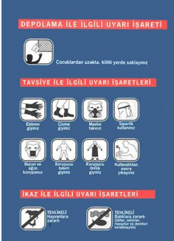
Resim 7. Zirai mücadele ilacı etiketinde yer alan bazı uyarı işaretleri.