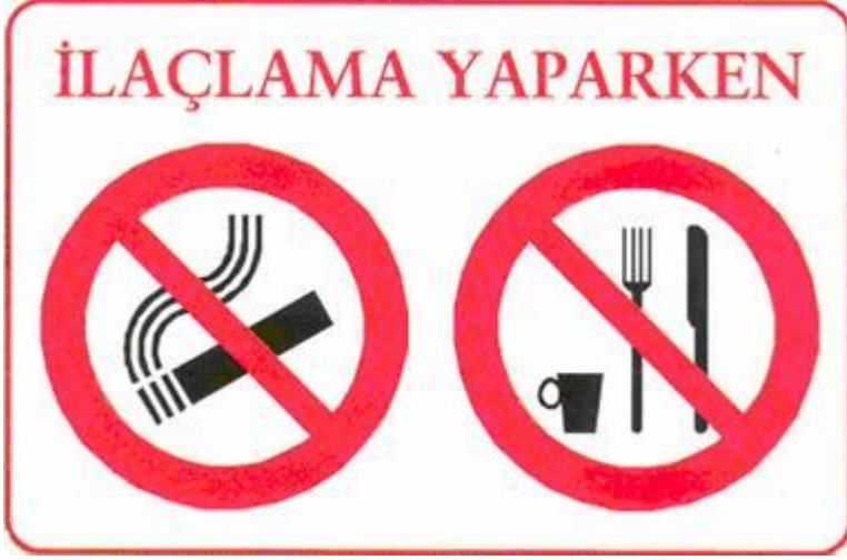
Resim 6. Zirai mücadele ilaçları ile çalışırken sigara içmeyin, yiyecek yemeyin, bir şey içmeyin.

Yukarıda açıklanan bilgilere ek olarak zirai mücadele ilaçlarını kullanırken vereceği zararları azaltmak için uyulması gereken diğer hususları da maddeler halinde görelim: