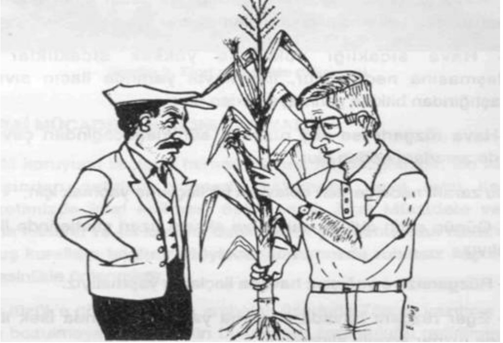
Resim 1. Hastalık, zararlı ve yabancı otlara karşı kullanılacak zirai mücadele ilacı konusunda danış.