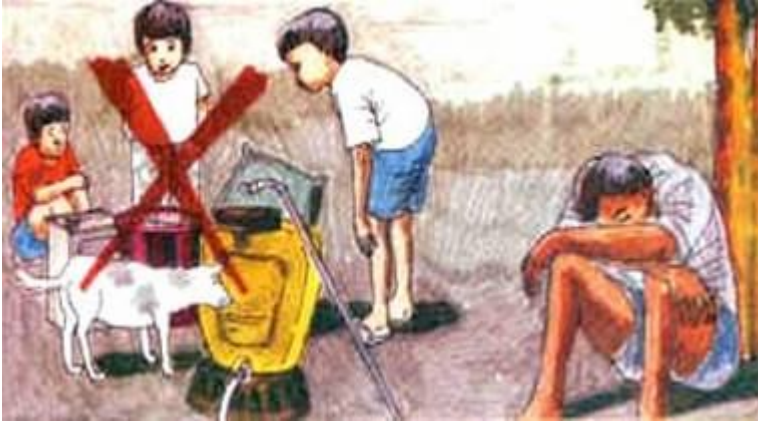
Resim 3. Zirai mücadele ilacı mutlaka uygun ortamlarda kullanıma hazırlanmalıdır.

- İlaç hazırlama işlemi oturma yerleri ile içerisinde gıda maddeleri ve yem bulunan mutfak, samanlık, ahır ve benzeri yerlerde asla yapılmamalıdır.