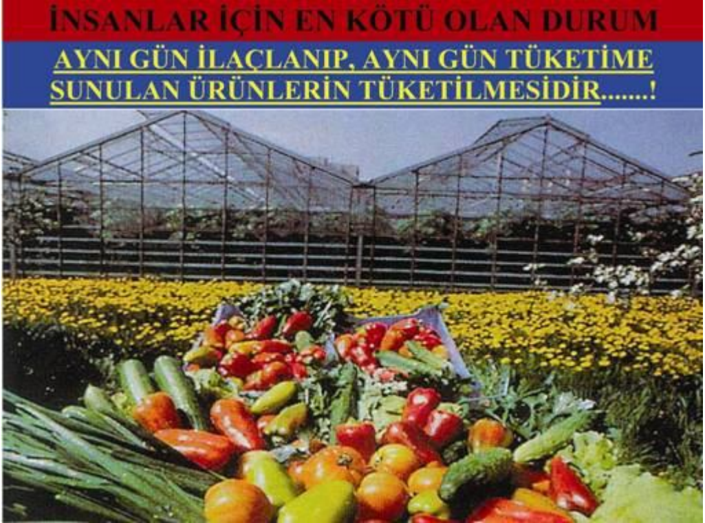
Resim 9. İlacın etiketinde belirtilen son ilalama ile hasat arasında gemesi gereken sreye mutlaka uyulmalıdır.

- İla etiketi zerinde yazılı son ilalama ile hasat arasındaki sreye mutlaka uyulmalı zamanından nce hasat edilmemelidir.