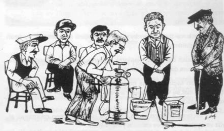
Resim 4. Kullanıcılar Eğitilmelidir.