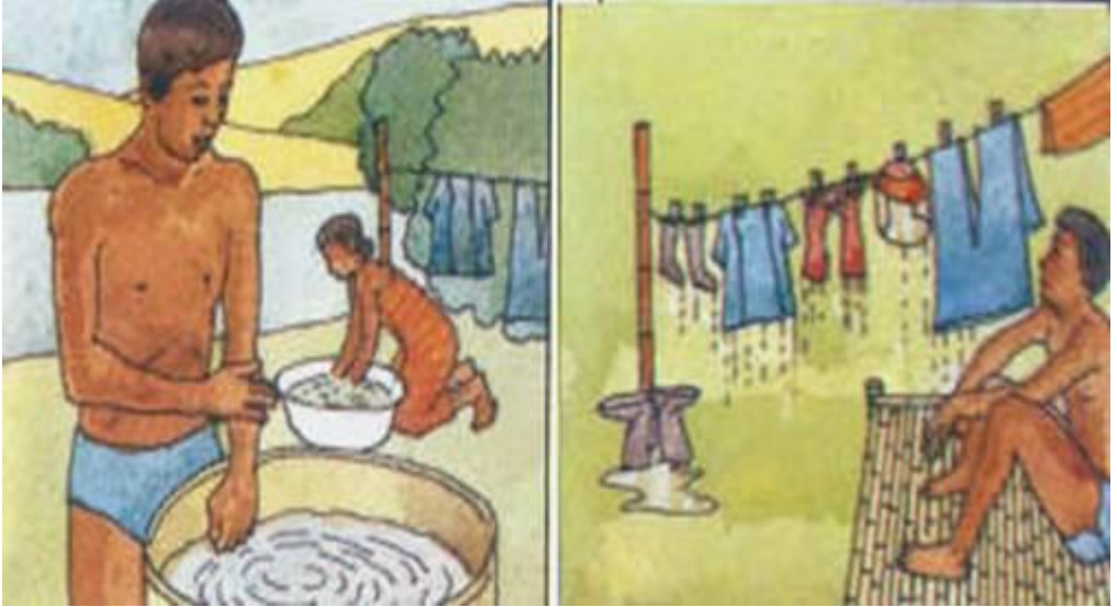
Resim 8. İlaçlamadan sonra kullanılan kıyafetler, el ve yüz bol sabunlu su ile yıkanarak temizlenmelidir.

- İlaçlamadan sonra el ve yüz bol sabunlu su ile temizlenmeli, ilaçlama esnasında kullanılan kıyafetler diğer elbiselerle birlikte temizlenmemelidir.