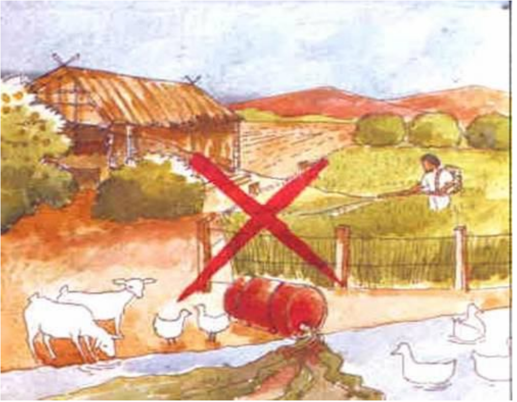
Resim 10. İlaç ve ilaç artıklarının canlıların bulunduğu alanlardan uzakta bulunmasına özen gösterilmelidir.

- Zirai mücadele ilaçlarının kalıntılarının yol açacağı sonuçlara karşı tedbirli olunmalıdır.