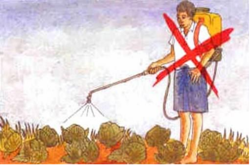
Resim 5. İlacın kullanıma hazırlanması ve ilaçlama süresince uygun koruyucu giysiler giyilmelidir.