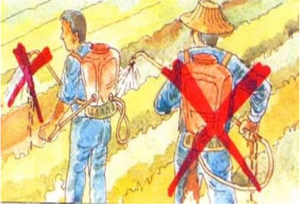
Resim 6. İlaçlamaya başlamadan önce ilaçlama aletinin mutlaka bakımı yapılmalıdır.