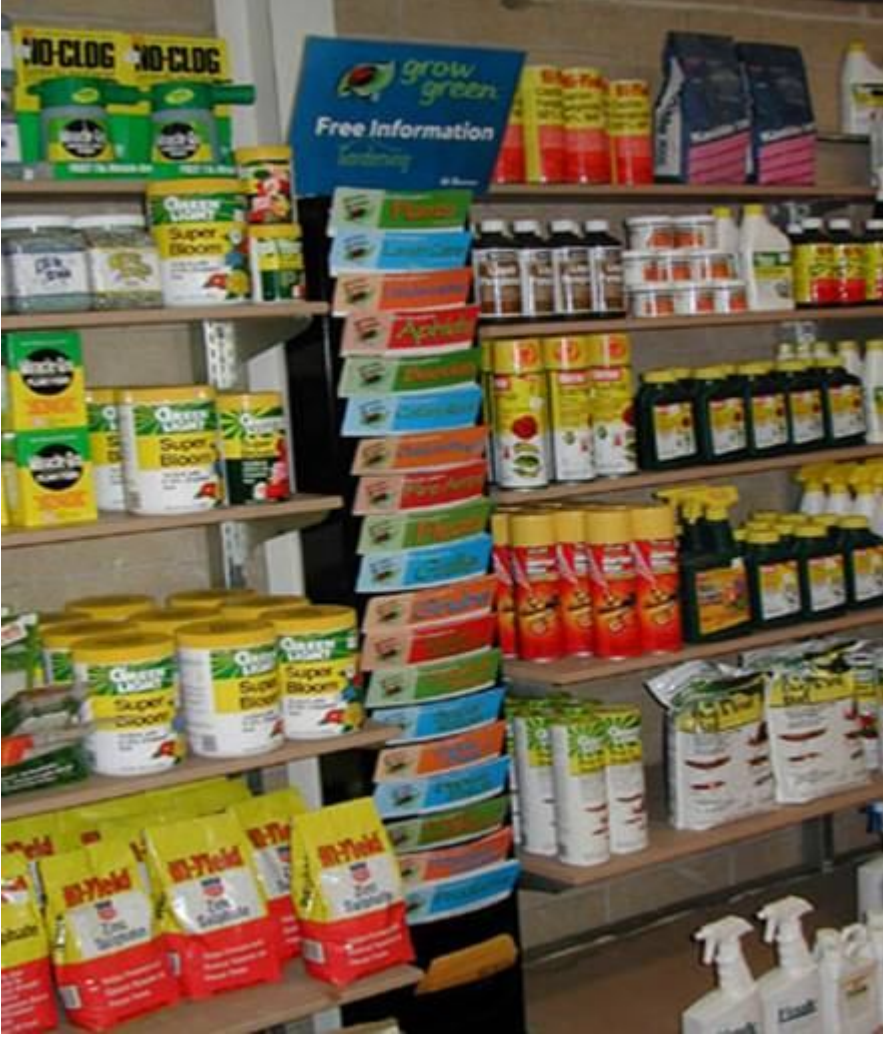
Resim 2. Zirai mücadele ilacı; yetkili zirai mücadele ilacı bayilerinden alınmalıdır.

veya ambalajı bozulmuş, raf ömrü dolmuş ilaç kesinlikle alınmamalıdır. Çünkü bu durumdaki ilaçlar bozulmuş olabilirler, hedeflenen etkiyi göstermeyebilirler veya bitkiye zararlı etki yapabilir. Ayrıca satın alacağımız ilaçların doğrudan güneş ışığına maruz kalmamış olmasına dikkat etmeliyiz.